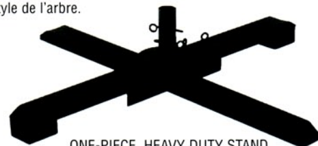
ONE-PIECE, HEAVY DUTY STAND BASE DE USO PESADO DE UNA SOLA PIEZA BASE D'UN SEUL MORCEAU SOLIDE